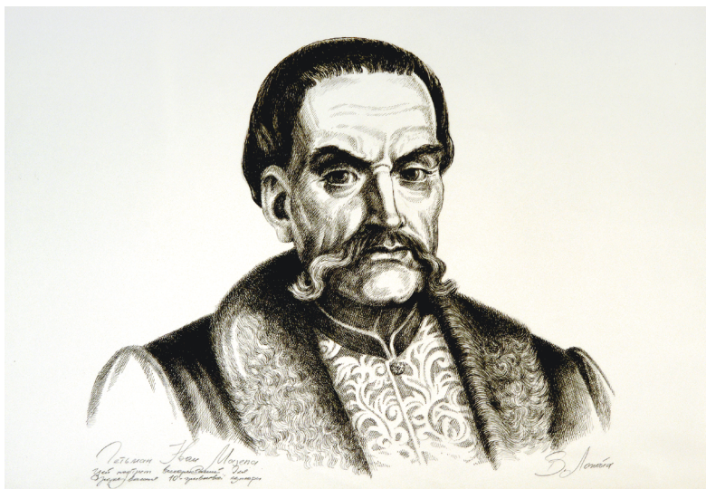
Il. 4. Wasyl Łopata, Iwan Mazepa, 1995.

Do początku lat 90. nie powstały prace graficzne poświęcone Iwanowi Mazepie. Ograniczono się tylko do opracowania grafiki waluty narodowej. Na potrzeby banknotów powstał obraz Wasyla Łopaty (il. 4). To jednak już odrębny temat.