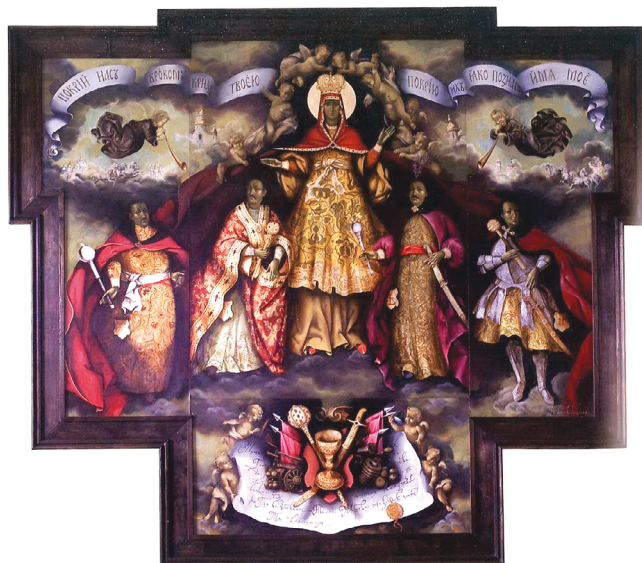
II. 6. Olha Kowtun, Pokrowa , 2008.