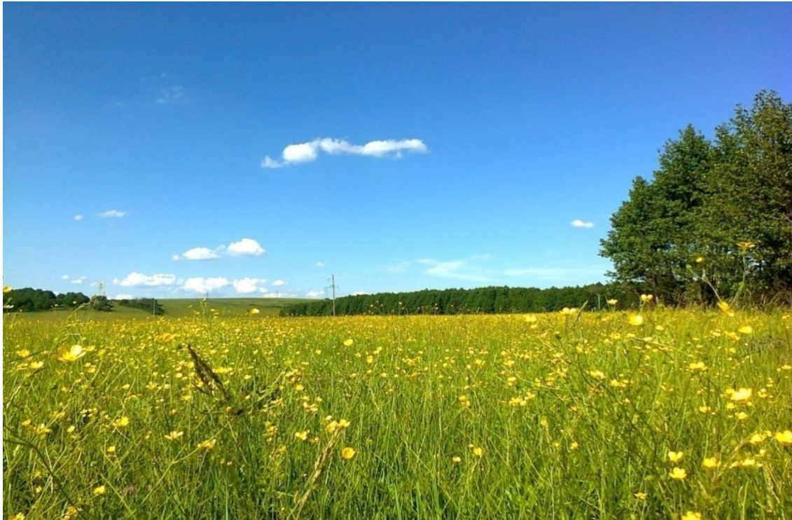
Рис. 4. Чутівські луки

Наведені факти та аргументи підтверджують те, що гетьманство І. Мазепа приймав поблизу сучасного смт. Чутове, де є велика долина для зібрання їжа та вода для коней (рис. 4).