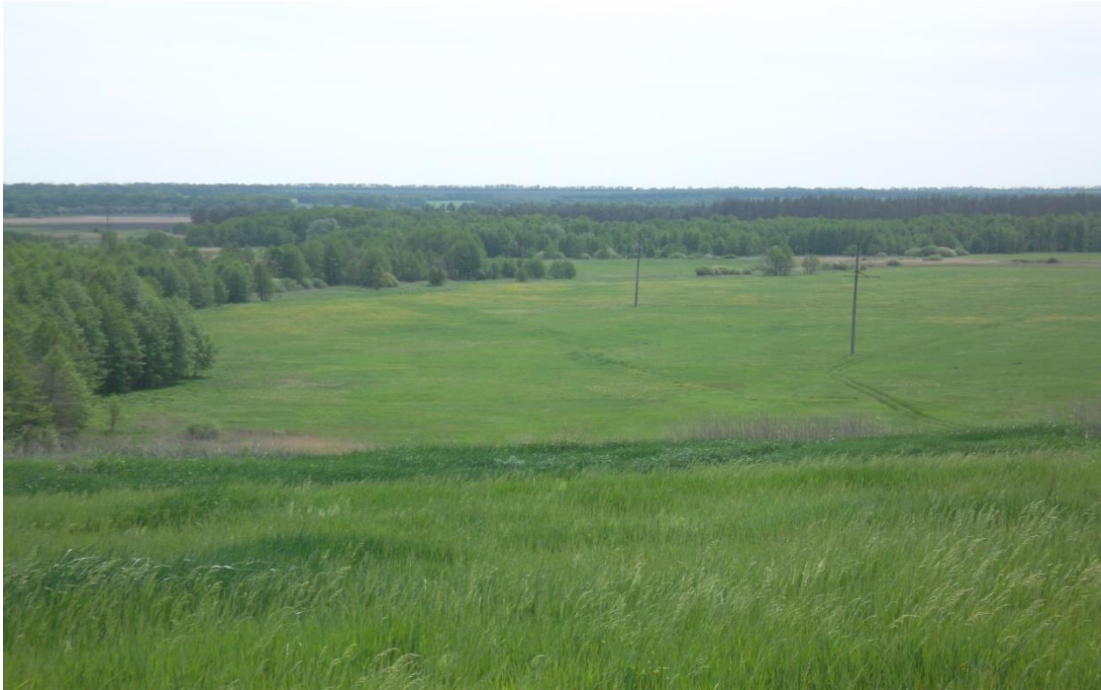
Рис. 2. Долина р. Коломак

Історична наука при аналізі подій спирається на різні дані. Тому для підтвердження своїх ідей розглянемо інше джерело – «Щоденник (1635–1699) Патрика Гордона» – очевидця та учасника тих подій. П. П. Брицький, П. О. Бочан вказують про П. Гордона: «Шотландець за походженням, який був на військовій службі в московській державі з вересня 1661 до 1699 року. Перед тим він був двічі на військовій службі у шведів і двічі – у поляків. І весь час вів щоденникові записи. В них є дуже детальні записи за час служби в Україні, де він перебував більшість років» [8].