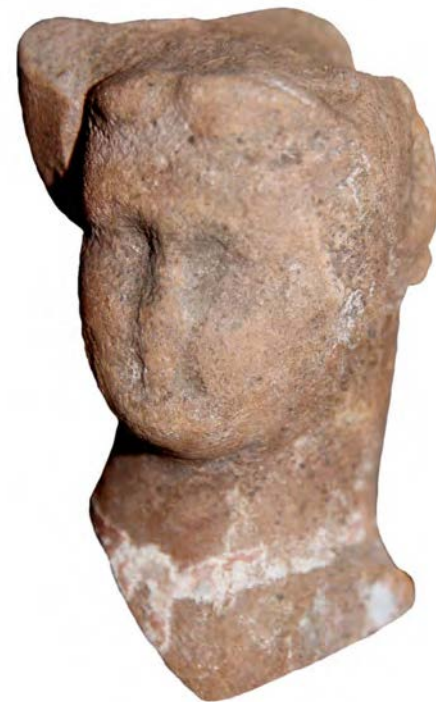
Уламок теракотової жіночої статуетки чи ляльки кінця XVII- початку XVIII ст., знайдений у Батурині. Музей археології Батурина.

Археологи звертаються до українських організацій, фондаций, компаній, громад і добровольців у Сполучених Штатах та Канаді з проханням надалі підтримувати розкопки Мазепиної столиці й публікацію їхніх результатів. Будь ласка, надішліть Ваші чеки з пожертвами за адресою: Prof. Martin Dimnik, Pontifical Institute of Mediaeval Studies, 59 Queen's Park Crescent E., Toronto, ON, Canada, M5S 2C4. Просимо виписати чеки на: Pontifical Institute of Mediaeval Studies (memo: Baturyn Project). Цей інститут надішле американським і канадським громадянам відповідні офіцій-