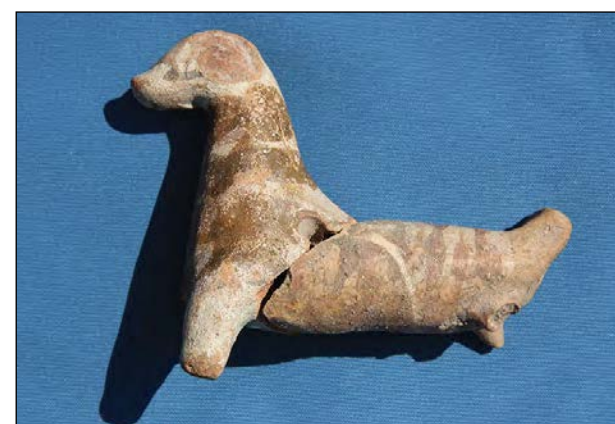
Знайдена у Батурині фрагментована керамічна розмальована іграшка-свищик у вигляді стилізованої тварини XVII-XVIII ст. Музей археології Батурина.