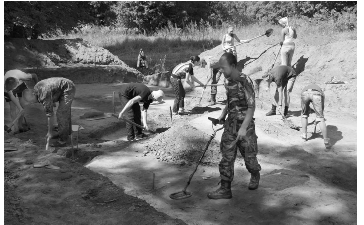
Розкопки залишок споруд на захід від палацу Мазепи на околиці Батурина Гончарівці з використанням американського металошукача.