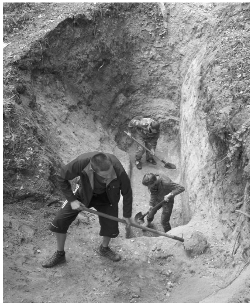
Розкопки решток підмурків і котловану Мазепиною палацу на Гончарівці.

У 2005 р. на місці розібраного східного флігеля палацу гетьмана Кирила Розумовського (1799-1802 рр.) археологи розкопали 17 поховань кінця XVII-початку XVIII ст. Як і на інших досліджених цвинтарях Батурина того часу, там виявили