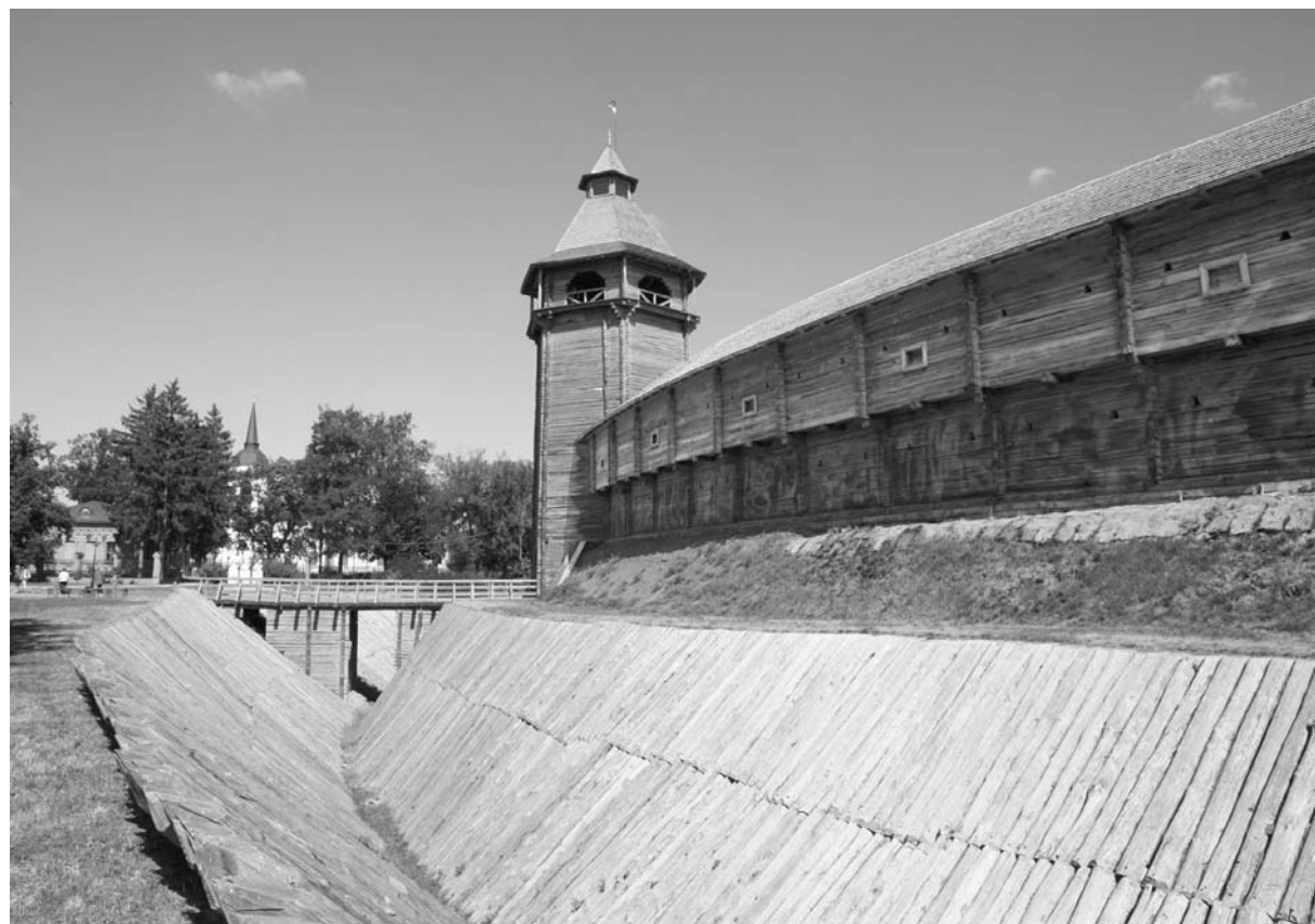
Зрубні надбрамна вежа й стіни, вал та рів, обкладений деревиною, цитаделі фортеці Батурина XVII ст. Реконструкція за археологічними даними 2008 р.

галі не допомагала вивченню Батурина і кошти діяспори тоді були єдиним джерелом для проведення розкопок міста та оприлюднення їх результатів.