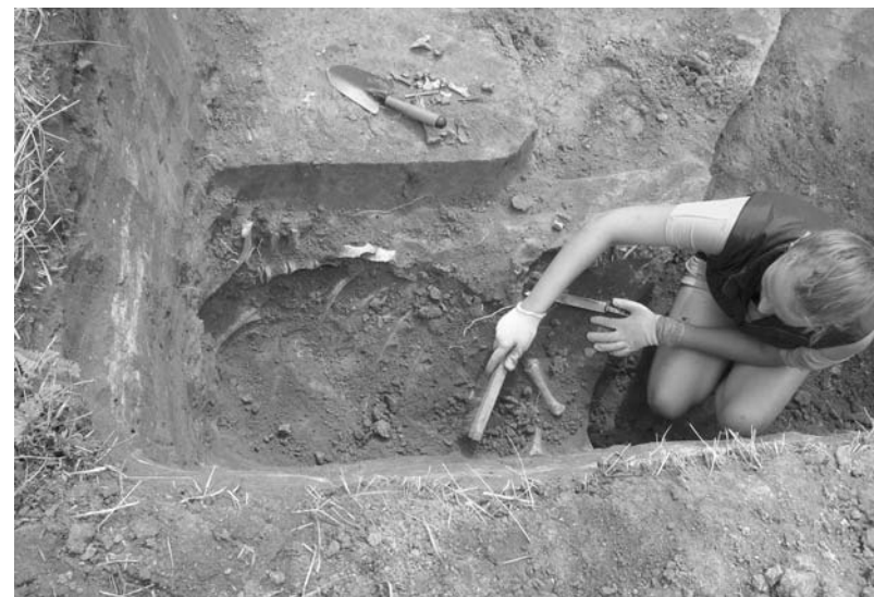
Розчистка кістяка імовірної жертви московського погрому Батурина 1708 р. Розкопки поблизу палацу Розумовського 2012 р.